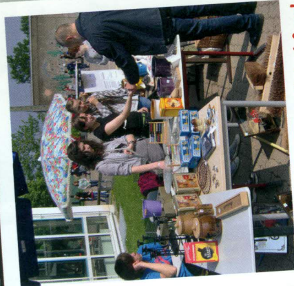
Tombola auf dem Schulfest